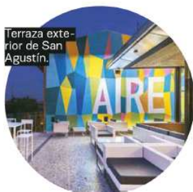
Terraza exterior de San Agustín.