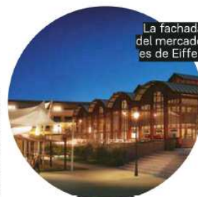
La fachada del mercado es de Eiffel.