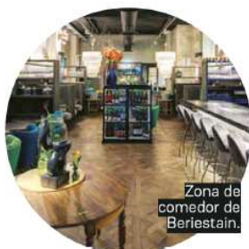
Zona de comedor de Beriestain.