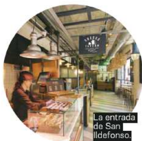
La entrada de San Ildefonso.